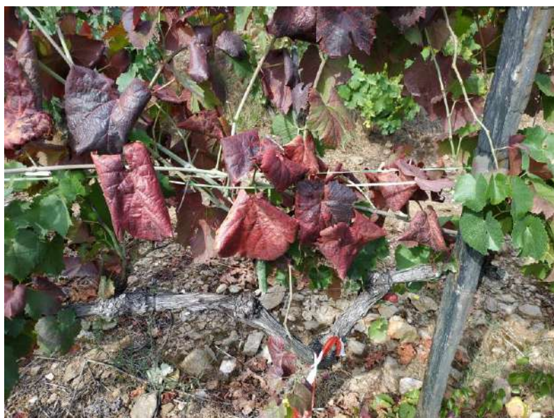
Videira com sintomas de Flavescência Dourada

Deverá ser guardado um registo da data da realização do tratamento, do produto utilizado e da dose aplicada , para efeitos de futuro controlo.