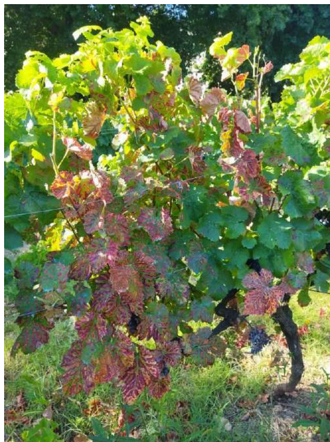
Sintomas de Esca.

Assim, aconselhamos os Srs. Viticultores a marcarem as videiras afetadas por esta doença , por forma a poderem proceder a medidas preventivas e de recuperação das plantas na altura da poda de Inverno.