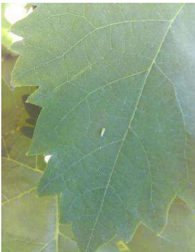
Ninfas de Cigarrinha.

Relembramos, que nesta fase, o Nível Económico de Ataque é de 50 ninfas por 100 folhas observadas ao acaso (duas folhas por videira).